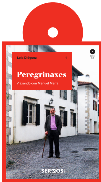
4 libros ou DVDs

Os/as subscritores/as de Sermos Galiza recibirán en 2017, a maiores do semanario (50 números por ano), un agasallo cada trimestre en forma de libro ou DVD. Así mesmo, recibirán outro libro (a escoller de dous posíbeis) como agasallo de recibimento.